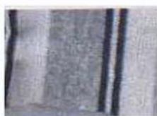
ملحق رقم (2) (عينات البحث)